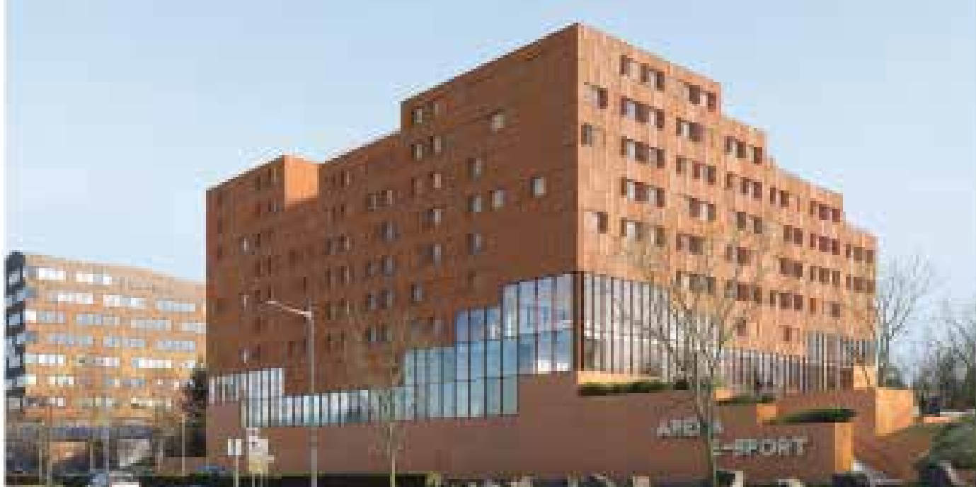
CAMPUS ESPORT ET RÉSIDENCE ÉTUDIANTE, Roubaix (59)