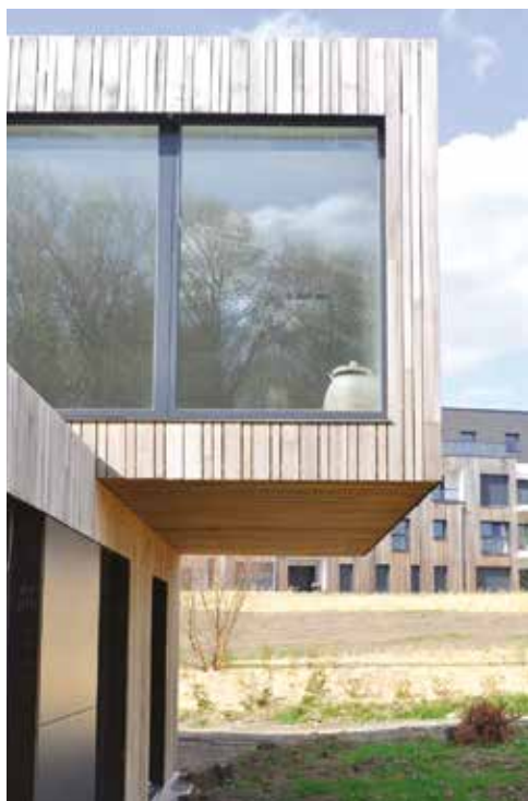
MAISON INDIVIDUELLE Bondues (59)