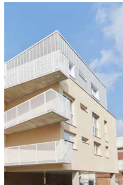
L'ORIGINELLE, Annœullin (59)

Historiquement ancrée dans le territoire des Hauts-de-France, iDéel répond également aux enjeux rencontrés par ses clients dans les régions Île-de-France, Grand Est et Bourgogne-Franche-Comté.