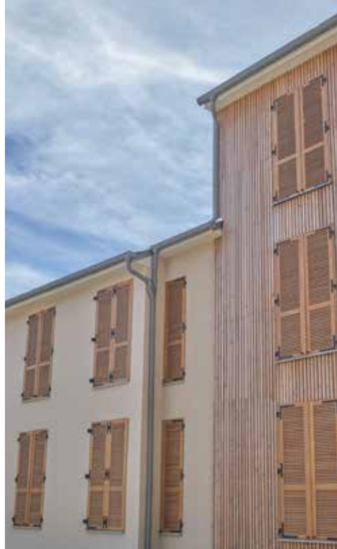
QUARTIER ORDENER, Senlis (60)