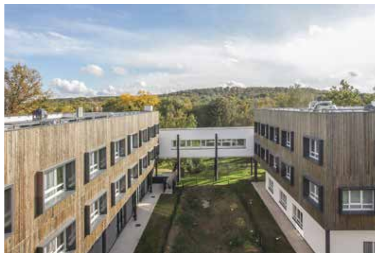
EHPAD, Dourdan (91)

+ de 90 M€ de C.A global en médico-social