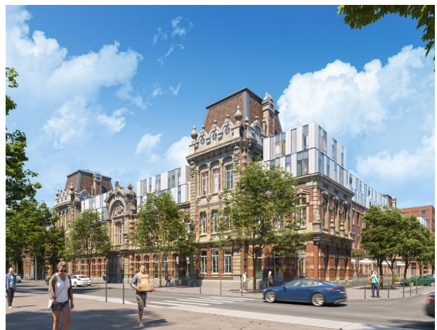
Restructuration du lycée Jean Macé à Lille en logements.