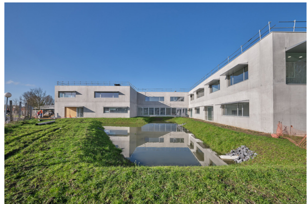
Campus Lesaffre à Marquette.