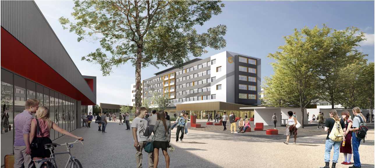
Cité universitaire Paul Appell à Strasbourg Contrat en conception-réalisation portant sur 1500 chambres étudiantes

Le groupe familial RABOT DUTILLEUL annonce avoir levé 51 millions d'euros de facilités bancaires syndiquées. D'une maturité de 5 et 6 ans, ces financements sous forme de crédits renouvelables et prêts moyen terme permettent au Groupe de consolider dans la durée sa structure de financement et d'accélérer sa transformation dans le cadre de son projet stratégique.