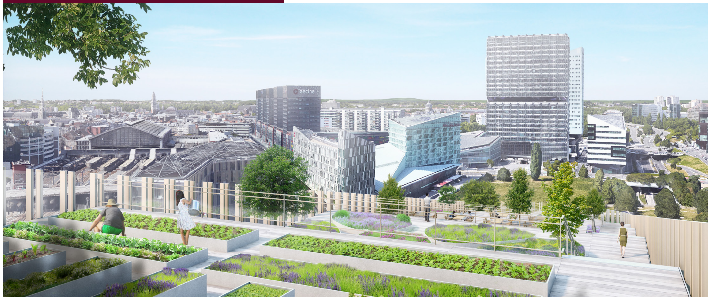
Vue depuis le toit de ShaKe, laboratoire des bureaux de demain à Lille